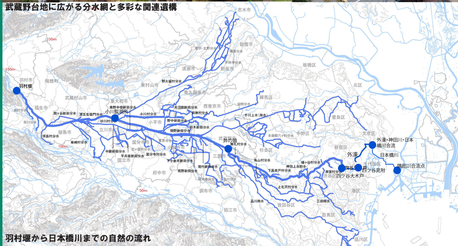
羽村堰から日本橋川までの自然の流れ